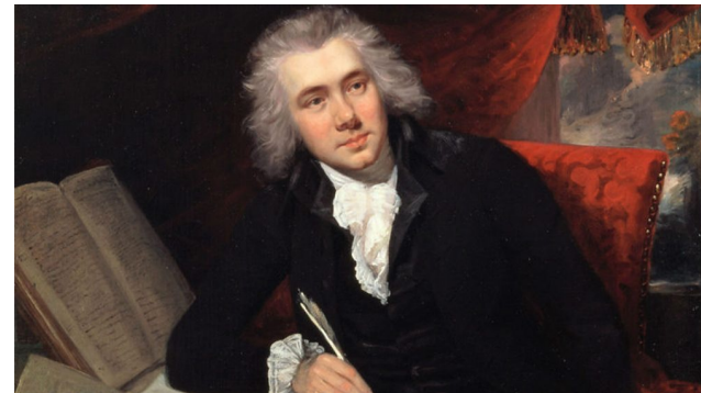
John Piper, Amazing Grace in the Life of William Wilberforce (Crossway Books, 2006).