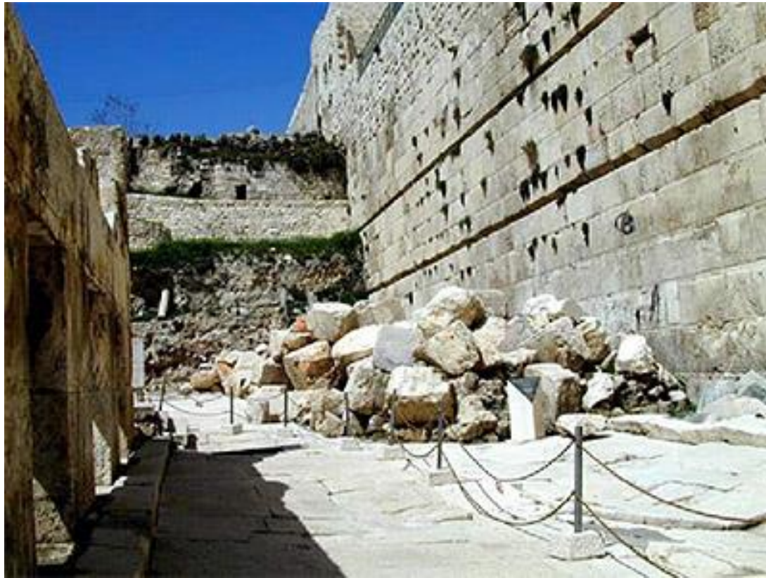
耶路撒冷聖殿遺址－留意牆的石塊